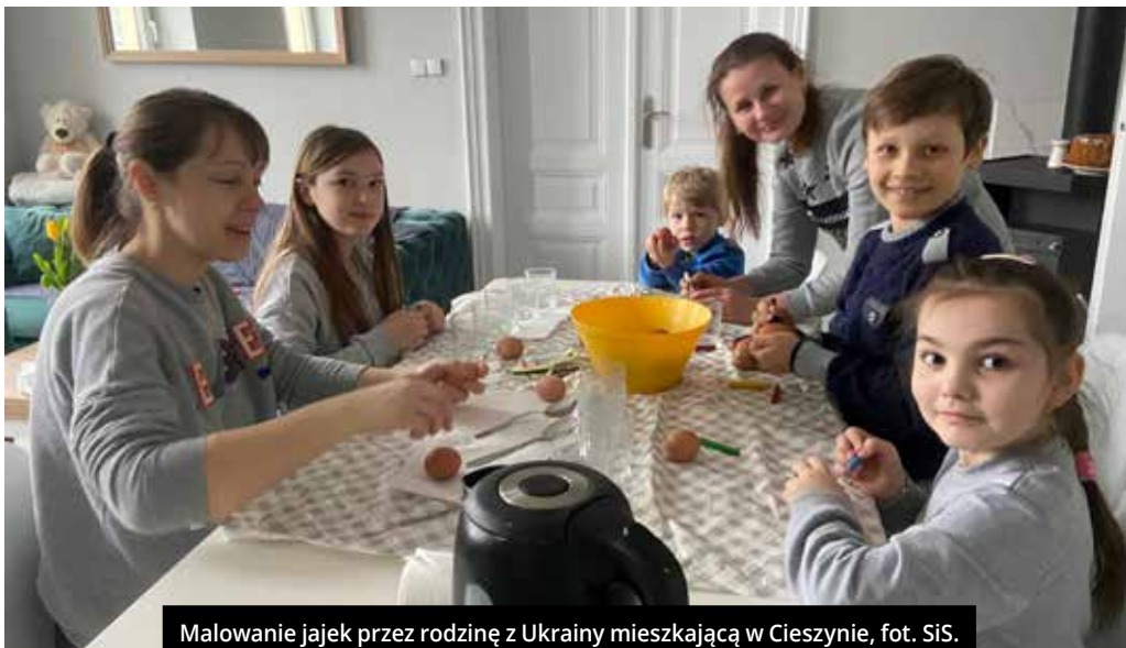
Malowanie jajek przez rodzinę z Ukrainy mieszkającą w Cieszynie, fot. SiS.

Z soboty na niedzielę odbywa się w cerkwi czuwanie. Wieczorem w Wielką Sobotę, albo w nocy przed Wielką Niedzielą (Великдень), w naszych świątyniach odbywa się święcenie koszyczków z wielkanocnym jedzeniem. Na wsiach często