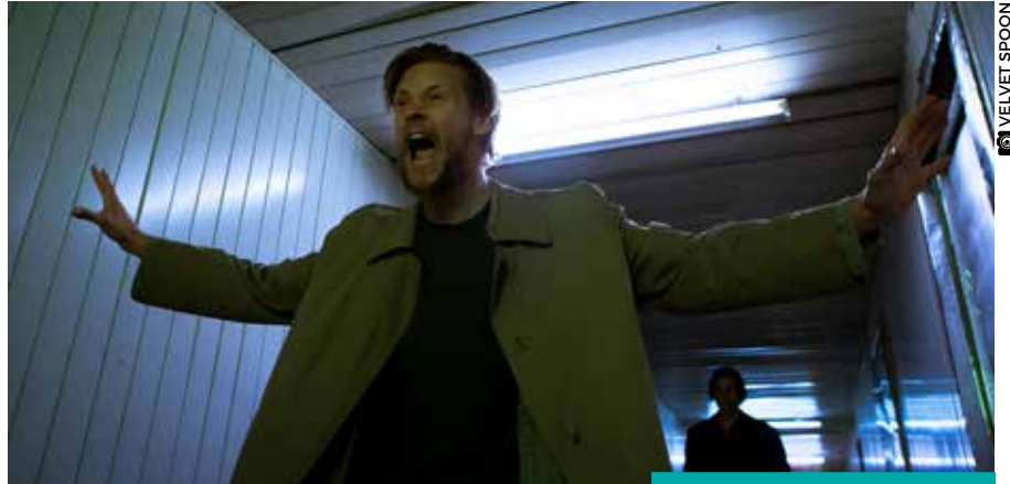
Kadr z filmu „Mowa ptaków”.

– Zdaję sobie sprawę, że kino Andrzeja Żuławskiego nie jest i nigdy nie było propozycją dla każdego, podobnie reszta jak kino Grzegorza Królikiewicza,