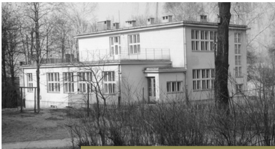
Pawilon RTG w Szpitalu Śląskim, ok. 1930 r.

Był to jedyny pawilon, w którym zainstalowano centralne ogrzewanie (pozostałe ogrzewane były piecami kaflowymi). Na obu kondygnacjach zachowano podział na skrzydła: jedno przeznaczone było dla mężczyzn, drugie dla kobiet. Na narożniku drugiej kondygnacji północnego skrzydła znajdowała się przeszklona sala operacyjna z doświetleniem nie tylko bocznym, ale i górnym! Poprzedzał ją gabinet wykorzystywany do podawania narkozy eterowej lub chloroformowej. Po przeciwległej stronie korytarza znajdowały się cztery pomieszczenia: na narożniku ulokowano łazienkę, obok niej – toaletę, dalej znajdował się szyb windy o napędzie hydraulicznym – pierwszej windy w Cieszynie (!) oraz pomieszczenie dla pierwszego w cieszyńskim szpitalu aparatu Roentgena. Obrazy uzyskane aparatem rentgenowskim w postaci fotografii naklejało (jak to było wówczas w zwyczaju) na firmowe tekturki warsztatów fotograficznych. W takiej postaci wykorzystywane były do celów naukowych zapewne podczas licznych sympozjów, organizowanych przez dyrektora szpitala, dra Hermanna Hinterstoissera.