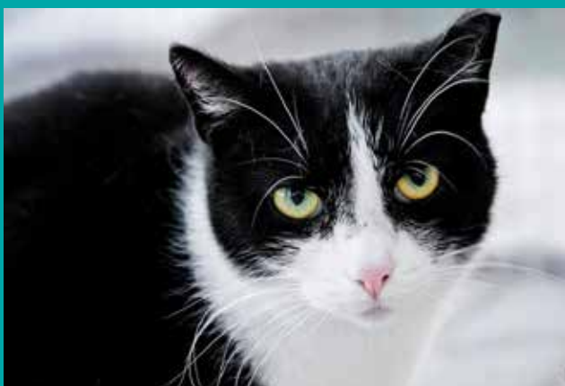
FUNDACJA „LEPSZY ŚWIAT”

Pod opieką Fundacji „Lepszy Świat” znajduje się dużo psów i kotów, które czekają na nowy, kochający dom.