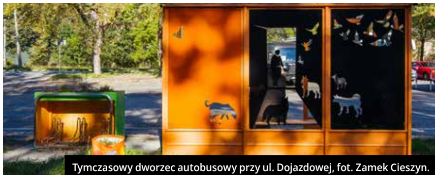
Tymczasowy dworzec autobusowy przy ul. Dojazdowej, fot. Zamek Cieszyn.

Zamek Cieszyn po raz drugi dołączył do grona europejskich miast tworzących platformę Human Cities. Nowej edycji projektu towarzyszy hasło: Twórcze działania w małych i odległych miejscach. W Cieszynie miejscem działań będzie Bobrek.