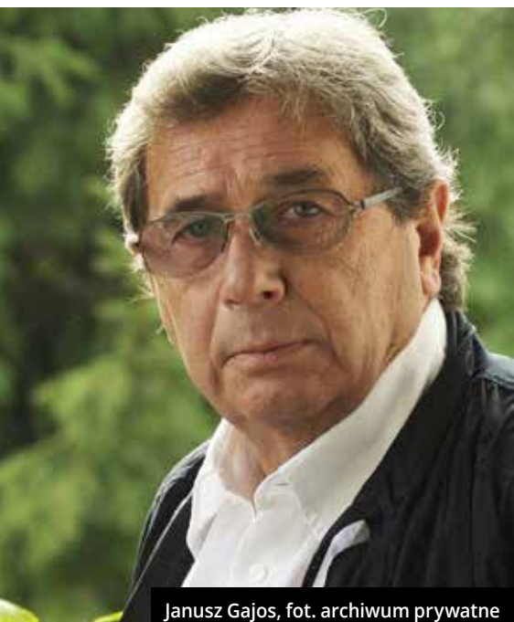
Janusz Gajos

Janusz Gajos jest jednym z najbardziej cenionych przez kinomanów i rozpoznawalnych polskich aktorów. Do jego najślynniejszych ról należą te w „Czterech pancernych i psie”, „Piłkarskim pokerze”, „Wahadełku”, „Ucieczce z kina Wolność”, „Żółtym szaliku”, „Przesłuchaniu”, „Jasminum”, „Układzie zamkniętym”, „Body/ciele”. Ostatnio widzowie widzieli go między innymi w filmie „Kler” i serialu