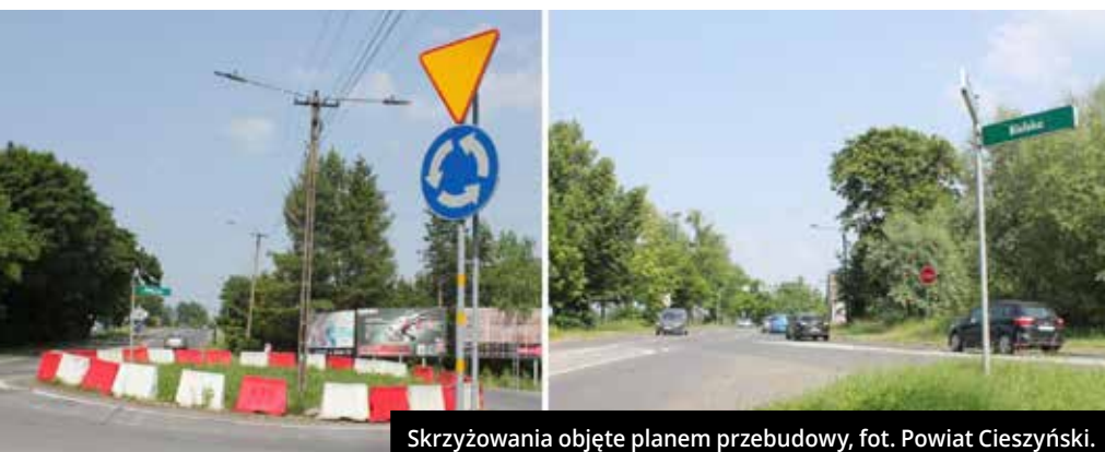
Skrzyżowania objęte planem przebudowy, fot. Powiat Cieszyński.

W ubiegły czwartek w Starostwie Powiatowym na spotkaniu Zarządu Powiatu Cieszyńskiego, Burmistrz Miasta Cieszyna i jej zastępców oraz przedstawiciele Miejskiego Zarządu Dróg, a także Powiatowego Zarządu Dróg Publicznych w Cieszynie wybrano koncepcję wykonania rozbudowy drogi powiatowej 26195 ul. Bielskiej w Cieszynie wraz z głównymi skrzyżowaniami – z ul. Stawową i ul. Wiślańską.