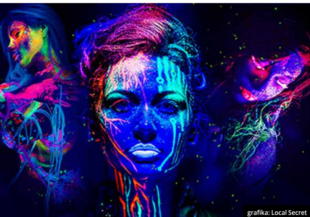
grafika: Local Secret

Tego dnia przestrzeń Browaru Zamkowego stanie się jeszcze bardziej magiczna, a to wszystko za sprawą przede wszystkim niesamowitych artystów.