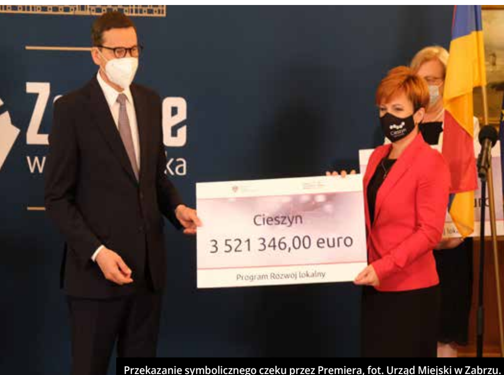
Przekazanie symbolicznego czeku przez Premiera, fot. Urząd Miejski w Zabrze.

Wielu czasu poświęciliśmy, zarówno w pracach komisji, jak i na sesji, na dyskusję nad Raportem o stanie Gminy Cieszyn za 2020 r. Można się z nim zapoznać na naszej stronie internetowej i w Biuletynie Informacji Publicznej, do czego Państwa zachęcam. Wiedza o stanie naszego miasta pozwala nam lepiej zrozumieć decyzje podejmowane przez Radę Miejską i Burmistrza. ◆