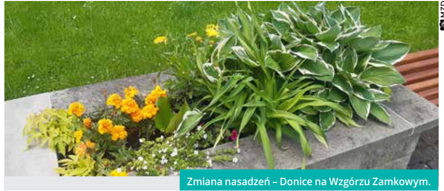
Zmiana nasadzeń – Donice na Wzgórzu Zamkowym.

Jesteśmy pewni, że niosą one nie tylko korzyści dla środowiska, ale również sprzyjają dobremu samopoczuciu mieszkańców. Wszystkiemu oczywiście towarzyszy rów-