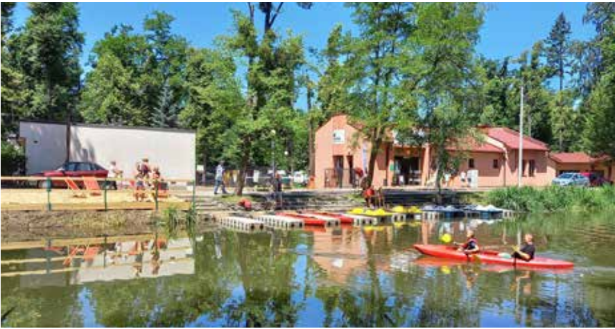
FOT. CAMPING POD CZARNYM BOCIANEM

Na ten moment czekało wielu z nas. Początkiem czerwca „Camping Pod Czarnym Bocianem” powitał gości, przyciągając do miasta nad Olzą miłośników caravanningu. Wśród pięknej zieleni pojawiły się namioty, przyczepy kempingowe i kampery. To znak, że obiekt zwany wcześniej jako „Camping Olza” zyskał nowego gospodarza, a właściwie gospodarzy.