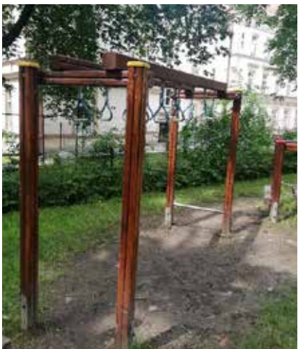
Naprawa urządzeń w Parku Kasztanowym.