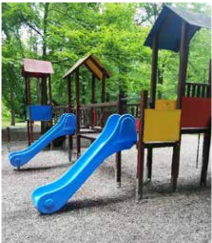
Montaż zjeżdżalni w Lasku Miejskim.