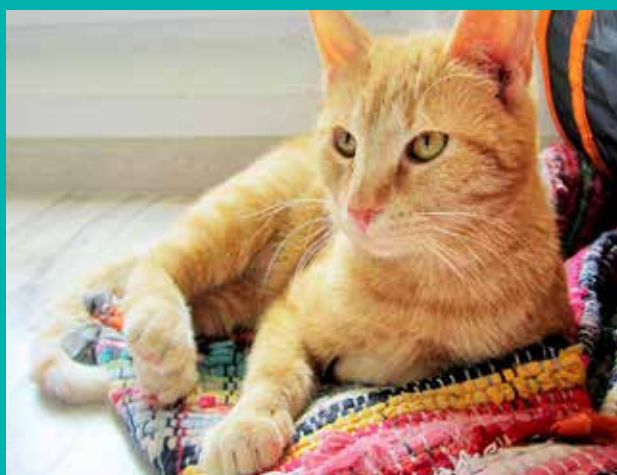
FUNDACJA „LEPSZY ŚWIAT”

Pod opieką Fundacji „Lepszy Świat” znajduje się dużo psów i kotów, które czekają na nowy, kochający dom.